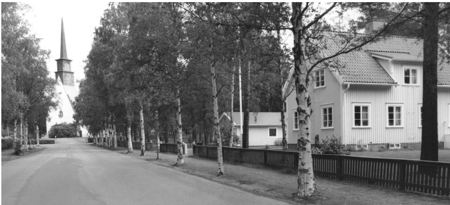
S:t Örjanskyrkan, Skelleftehamn