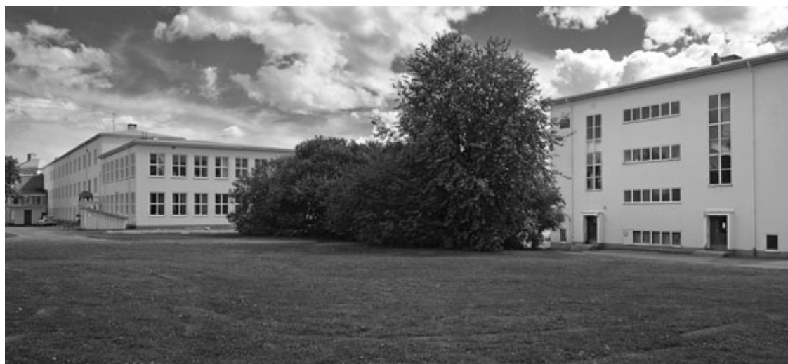
Skellefteå museum, Nordanå