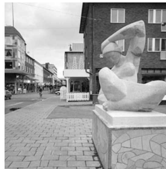
Liggande damen, Odentorget