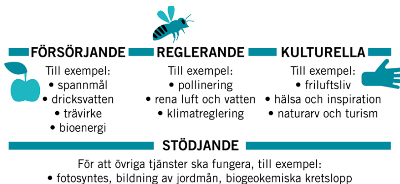
Figur: Ekosystemtjänsterna kan delas in i fyra grupper

Ett ekosystem bidrar med flera tjänster på samma gång, så kallad multifunktionalitet. Grönskan och vattnet i staden ger till exempel renare luft, bättre lokalklimat, ökad hälsa, klimatanpassning, bullerdämpning och möjlighet till närodlat föda.