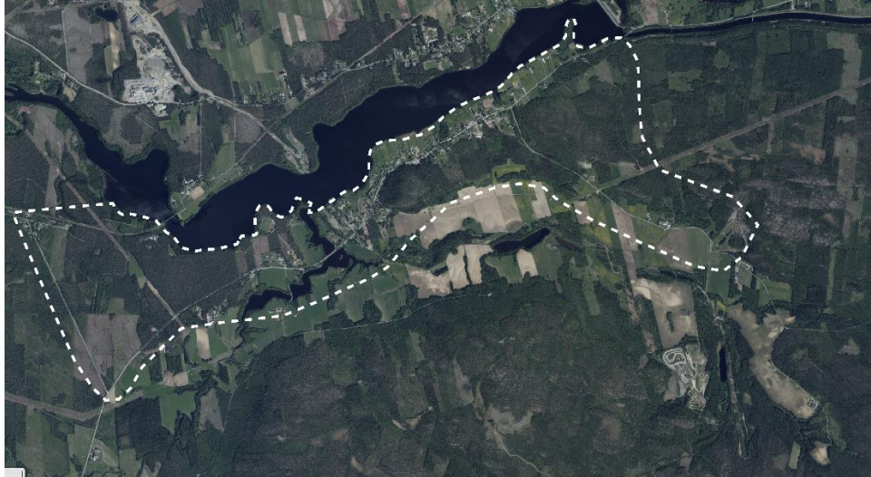
Figur 2. Planområde för planprogram Klutmark (Skellefteå kommun (GIS) Lantmäteriet).

Området som kommer utredas i planprogram Klutmark är cirka 800 hektar, se Figur 2. Men området kan komma att minska eller utökas under arbetets gång beroende på områdets förutsättningar. Marken ägs mestadels av privata aktörer.