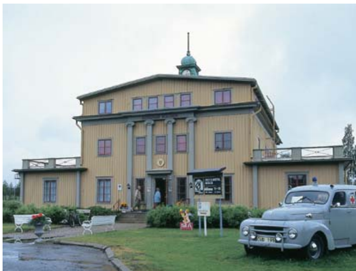
Bergrum Boliden är ett gruv- och geologimuseum i det gamla gruvkontoret.

Vi tar en promenad ned efter vägen mot den gamla kraftstationen som numera är museum.