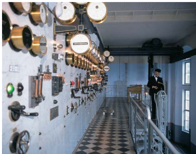
Marmor och mässing är slående inslag på manöverpanelen i Finnforsens gamla kraftstation.