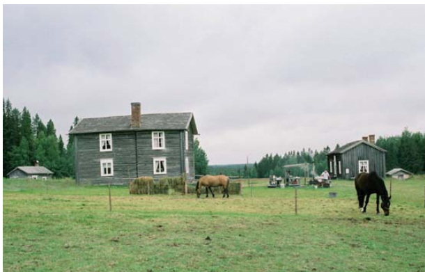
Nybygget Rismyrliden.

På 1870-talet såg Rismyrliden ut ungefär som det gör i dag. Det mesta man behövde framställdes på gården. Det lilla överskott som jordbruket kunde ge byttes mot sådant som man själv inte kunde framställa. Tjärbränning, kolning och skogsarbete gav behövliga kontanter. Fram till slutet av 1960-talet var gården bebodd men sedan flyttade de sista brukarna på ålderns höst till Skellefteå.