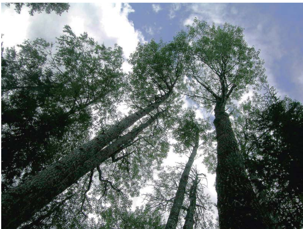
Jätteasparnas skog har troligen de äldsta asparna i landet.

Den gamla talldominerade barrblandskogen som möter oss har en tydlig naturskogsprägel med hänglavsprydda grenar. Längre in i reservatet finns fuktigare marker och en ståtlig granurskog med en ovanligt rik flora av vedsvampar. Stigen som går genom området utgör en del av Kyrkstigen som fanns inritad på kartor redan på 1600-talet och som nu är en vandringsled mellan Landskyrkan i Skellefteå och Burträsk kyrka.