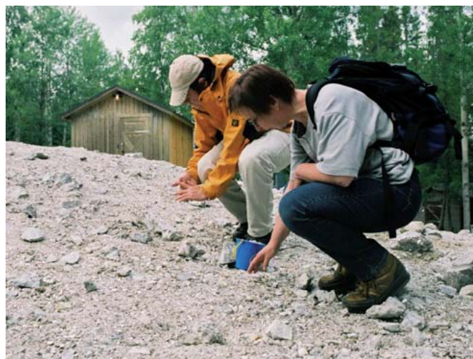
Mineralletning i Varuträsk.

Vi åker vidare längs Brännavägen ut på Bolidenvägen och svänger in på väg 95 västerut. Efter ca 8 km från Skellefteå följer vi skyltningen mot Vildmarksgruvan. Gruvan i Varuträsk var aktiv fram till 1946