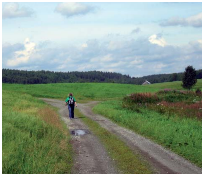
Kyrkstigen i Ragvaldsträsk. Foto Lage Johansson.

Vi tar stigen tillbaka för ett besök i Tjärnberghedens naturreservat. Vi kör tillbaka mot Skråmträsk och svänger höger mot Brännvattnet och höger igen en bit in i byn. Vi passerar byarna Västra Kyrkbäcken och Brännvattnet och märker sedan hur skogs- och myrlandskapet tar över vyerna. Efter knappt 8 km parkerar vi bilen där det är skyltat "Kyrkstigen" och följer stigen söderut i ca 600 m.