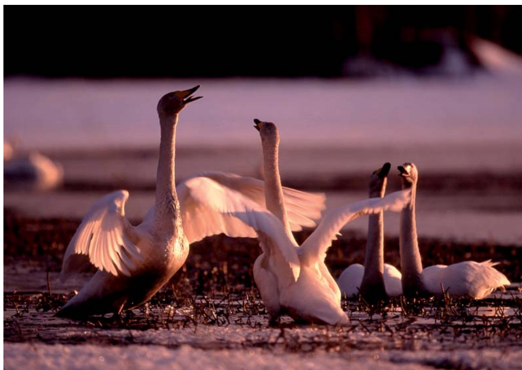
Sångsvanarna rastar gärna vid Ostrträsket på väg mot häckningsplatserna i fjällen.

På våren är det vanligt att se skogsfågel och ringduva längs de vägar som går genom skogslandskapet. Chanserna är som störst tidigt på morgonen men den här tiden på året är det värt att alltid hålla ögonen öppna – helt plötsligt står han kanske där med sträckt hals, den svarta tjädertuppen.