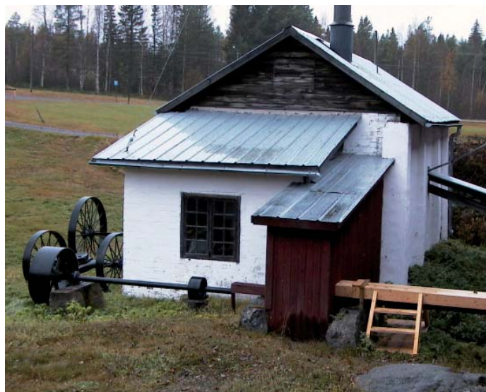
Maskinhuset vid ångsågen i Drängsmark.

Efter ca 8 km kommer vi till Furuögrund som idag är en ljuvlig idyll intill havet. För hundra år sedan var det ett livligt industrisamhälle. Åren 1874-1875 uppfördes en ångsåg. Då fanns i Furuögrund endast nio gårdar. Kring sågen växte dock ett helt samhälle fram med affärer, caféer, skola mm. Under en tid bodde fler människor i Furuögrund än i Byske. Efter femtio års drift lades sågen ned. Efter ytterligare 3 km når vi Byske. Väl på plats kan vi passa på och ta oss en fika eller bit mat innan vi åker vidare upp längs Byske älv.