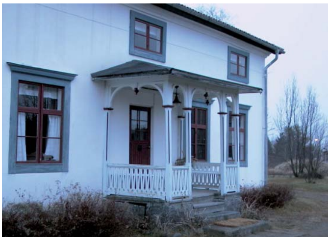
Den privatägda Rijfska gården är lagskyddat byggnadsminne.

Fortsätter man vägen rakt fram i ca 4 km kommer man till hembygdsområdet vid Kvarnforsen. Där finns bl.a. ett hembygdsmuseum och den unika ångsågen att beskåda. Ett stycke unik kulturhistoria väl värt ett besök. Sågen utsågs till Årets industriminne 2007!