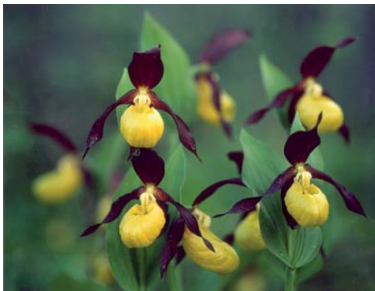
Den vackra guckuskon kan man få se i naturreservaten i Övre Kågedalen.

Vi lämnar Brännberget längs den väg vi kom efter. Vi tar höger i T-korsningen och kommer till byn Nyholm efter knappt 4 km. Vi tar vänster och når Svanström efter ytterligare 4 km. Är det kväll kanske vi ser några rådjur som försiktigt stegat ut på någon av ängarna längs Klintforsån vi nu återigen följer. Vi tar höger ut till väg 95 och fortsätter sedan österut tillbaks till Skellefteå.