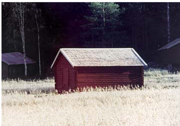
Slätterladorna står kvar i Tjärn och Innervik.

Vi fortsätter vidare genom byn och ges nya chanser att se fågel i det öppna landskapet som följer därefter. Efter knappt 3 km kommer vi till Södra Bergsbyn. Vi tar höger mot Örviken och hö-