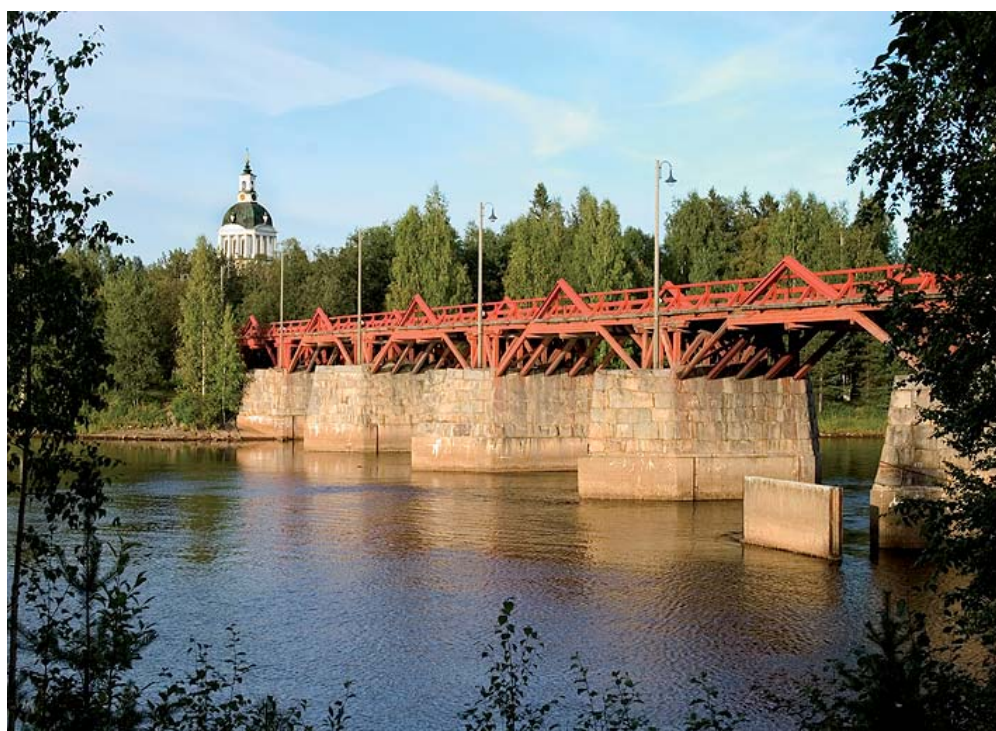
Lejonströmsbron med Skellefteå landsförsamlings kyrka i bakgrunden.

Den nedre delen av Kågedalen är ett av regionens aktivaste jordbruksområden med ett vidsträckt odlingslandskap som breder ut sig mellan samhällena och byarna. För byn Ersmark angavs