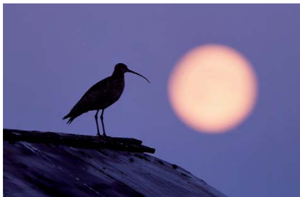
Karaktäristisk för kustens odlingslandskap är storspoven, vår landskapsfågel.

Tillbaka på huvudvägen åker vi fram till vägskälet mot Skelleftehamn. Här tar vi höger. Framme vid E4-an åker vi söderut några kilometer. Vi tar sedan av mot Bureå. Strax efter bron över Bureälven svänger vi vänster mot Burvik. Älven är en ständigt levande ådra, slingrande och forsande i lummig