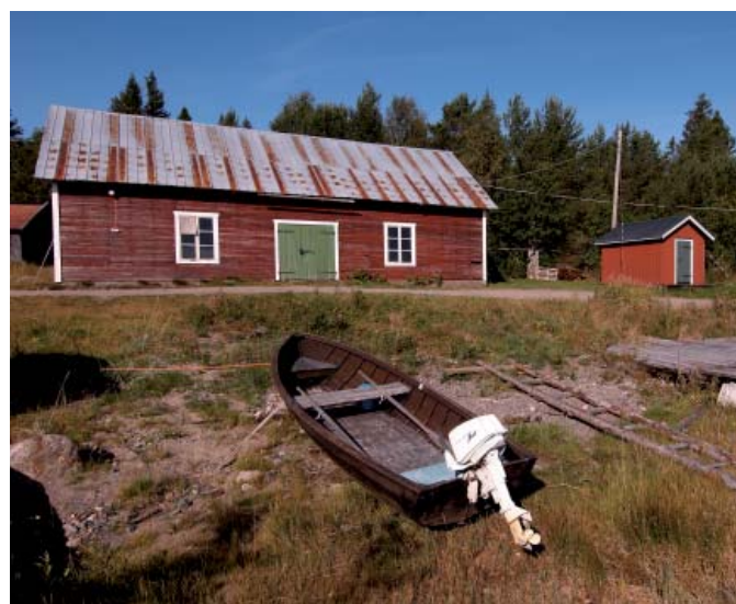
Sandvikens fiskeläge.

Efter utflykten till Sandviken fortsätter vi söderut. Snart glesnar skogen ut och vi kommer till Nedre Bäck. Vid tennisbanan grenar sig vägen. Bägge vägarna leder till Uttersjöbäcken. Vi väljer den till vänster som är bättre. Efter att ha passerat över en liten bro kommer vi upp på en grusås. Här ligger ett par järnåldersgravar, varav den ena grävdes ut 1970. I gravröset påträffande man klor av en björn.