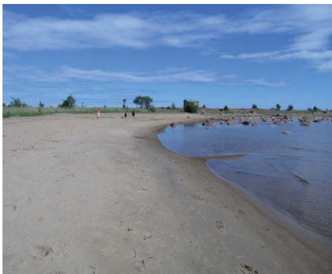
Grundskatan i Bjuröklubbs naturreservat.

Från Blackhamn åker vi västerut och svänger vänster i byn Blacke. Vi svänger vänster igen efter att ha passerat Blacksjön och fortsätter genom Böle och Gammelbyn där vi tar höger och åker in i Lövånger. Namnet Lövånger kommer från det vikingatida namnet på vik = ånger. Lövånger tros betyda "läviken". Bebyggelsen här är mycket gammal. Redan under medeltiden fanns här en kyrka. Traditionen säger att den första kyrkan skall ha legat vid Kyrksjön. Vid 1400-talets slut började man bygga den nuvarande kyrkan. Kyrkoplikten föreskrev att alla skulle gå i kyrkan. Bönder som bodde långt från kyrkan uppförde därför små stugor där de kunde