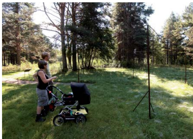
På Klosterholmen har de medeltida lämningarna åskådligtgjorts med luftiga järnkonstruktioner.

Efter Bureå slingrar sig vägen upp på Burberget, mitt på berget kan vi på vänster sida skymta ett